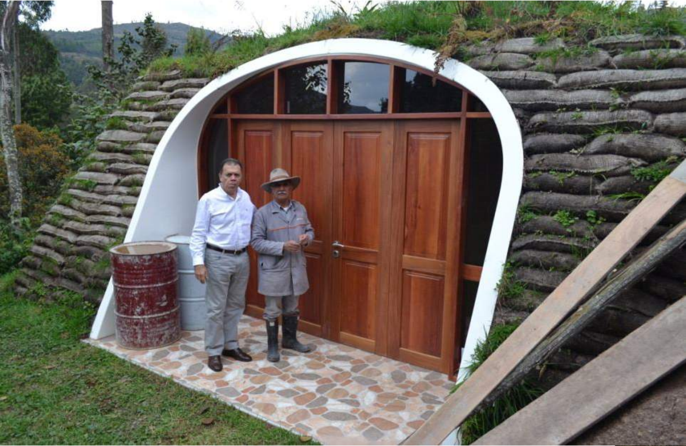
Esta planta de embotellado de Agua Gourmet, es un vivo ejemplo de una Arquitectura amable y respetuosa con el Medio Ambiente.